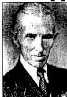
Експонати на изложби